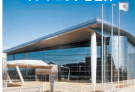
サンフロッグ春日井

TEL 0568-56-2277 〒486-0841 春日井市南下原町2-4-11